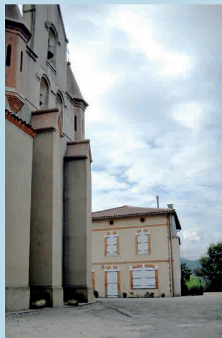
Le café de la place